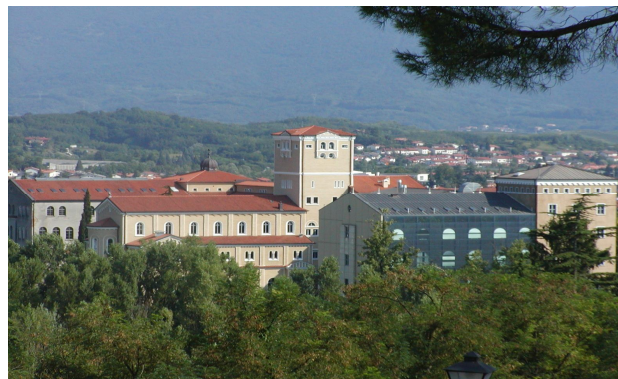
Università di Trieste — PUG